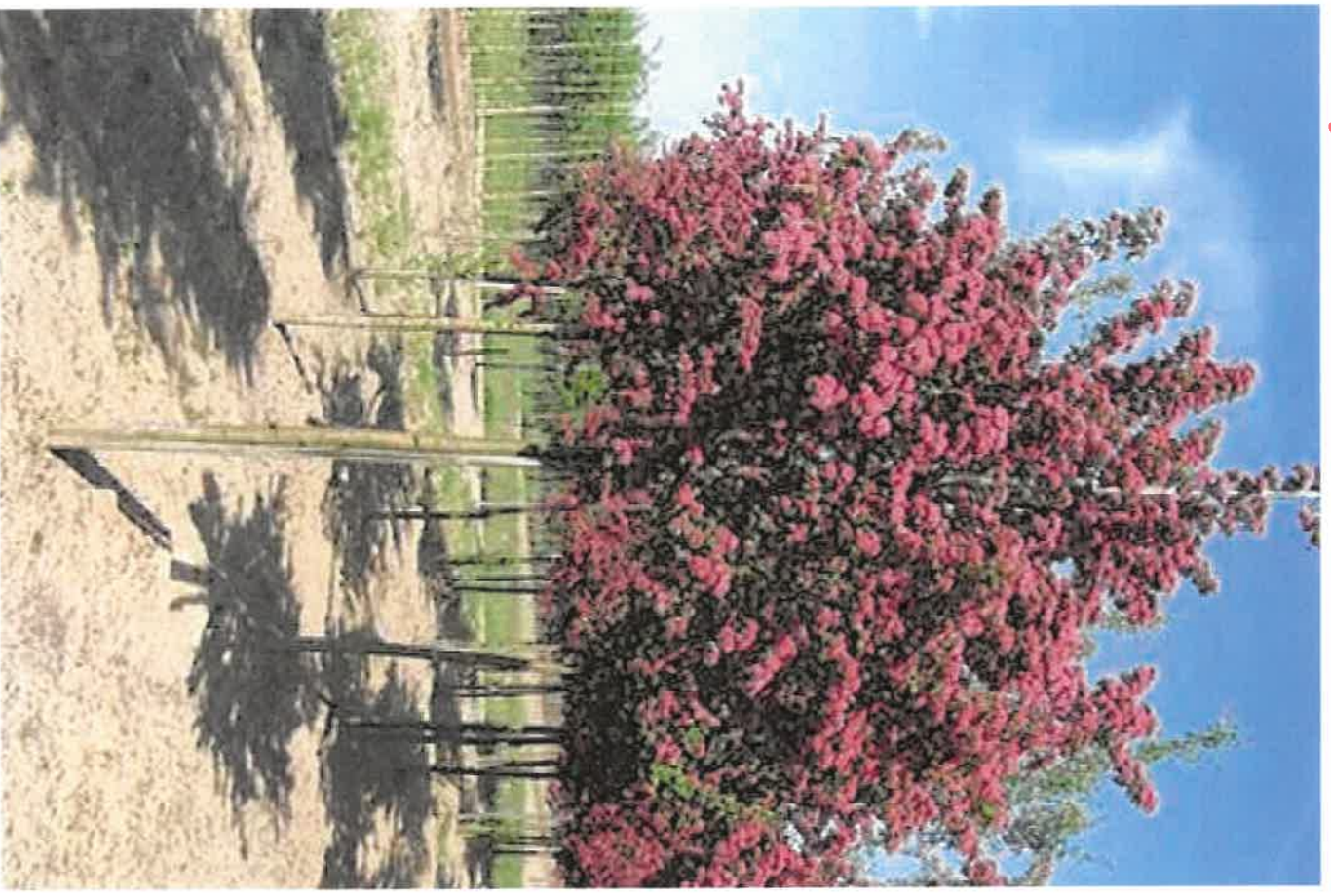
Salvia 'PAUL'S SCARLET'