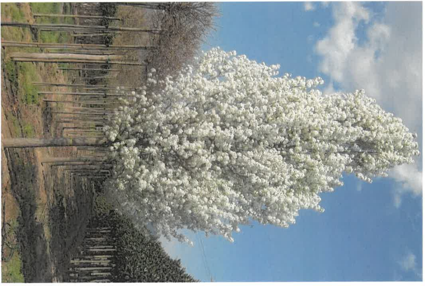
Salvia DEBBARDOSCOCI 'CHARMANTIGER'